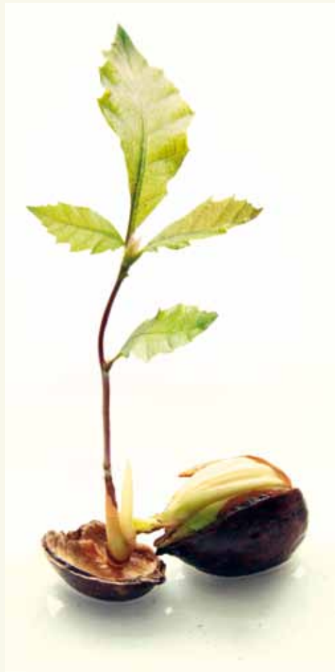
John Whitmore popularizó la famosa metáfora de la bellota frente al recipiente vacío: cuando nacemos, más que un recipiente vacío que ha de llenarse a lo largo de la vida, más bien somos como una bellota, que contiene en su interior todo el potencial para convertirse en un majestuoso roble.

REALITY : realidad actual, situación presente. El coach busca un lenguaje objetivo y descriptivo para explorar la realidad del cliente, ayudándole a alcanzar niveles profundos de conciencia. En esta fase, se realizan preguntas que apuntan a los hechos y que ayudan a pensar.